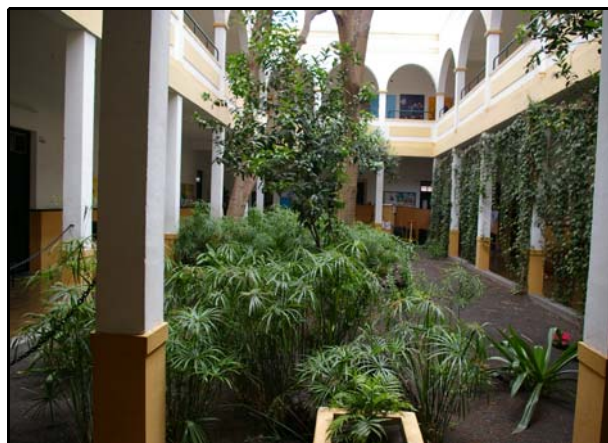
IES AGUSTÍN ESPINOSA INTERIOR

En noviembre se producirá la renovación del Consejo Escolar