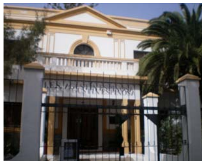
Fachada del Centro